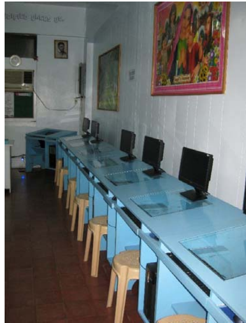
Abbildung 9 : Computerraum