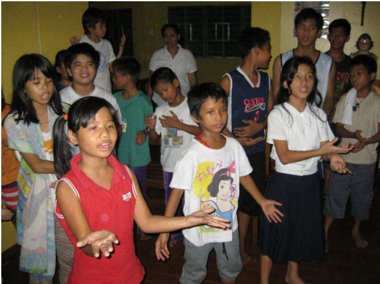
Abbildung 11 : ASVP Kinder Bei der Vorführung des Dankliedes

auf die richtige Bahn zu lenken. Und wenn es gelingt die Kinder durch geduldige Begleitung dauerhaft aus der Armut zu bekommen, so ist das langfristig mehr wert als kurzfristige „Brandlöschung“. Versanden wird eine mögliche Spende auf gar keinen Fall.