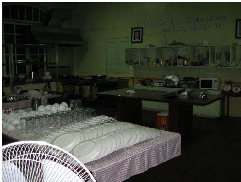
Abbildung 10 : Ausbildungsraum