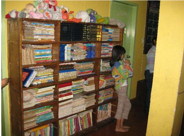
Abbildung 4 : Gemeinsam nutzbare Bücher