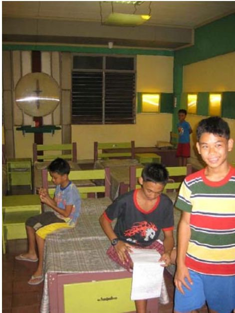
Abbildung 8 : Unterkunft der Jungen

Zusammen mit den Kindern im RENDU Home beherbergt die ASVP zurzeit ca. 60 Kinder im Alter von 5-20 Jahren. Bereits graduierte Kinder, die das Heim verlassen haben verpflichten sich weiterhin den Idealen der Daughters of Charity , sodass eine lebenslange Bindung entstehen soll.