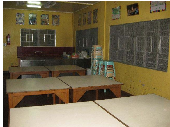
Abbildung 3 : Versammlungsraum