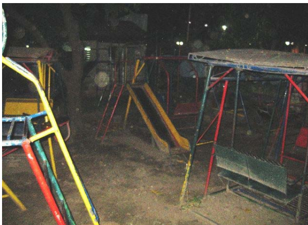
Abbildung 2: Spielfeld vor dem RENDU Home

Die erste Station war das RENDU Home, wo der erste Eindruck des materiellen Überflusses sehr schnell revidiert werden musste. In einem etwas ausgelagerten „Haus“ wohnen Mädchen und Jungen verschiedener Altersklassen, die von Sozialarbeiterinnen abwechselnd rund um die Uhr betreut werden. Im unteren Bereich gibt es einen großen Versammlungsraum inklusive sehr sehr einfacher sanitärer Anlagen und im oberen Bereich gibt es zwei einfache Schlafräume mit kleinen Schränken für die persönlichen Dinge der Kinder. Da die Kinder je nach Dauer ihres Aufenthalts in der Asilo noch nicht zivilisiert und reinlich sind, gibt es z.B. keine Matratzen auf den Betten der Jungen. In dieser Unterbringung wird Ihnen wie oben geschildert beigebracht einen festen Tagesablauf inklusive Waschen und Beten einzuhalten. Die Kinder hier wirkten sauber und gepflegt aber noch etwas wild und ungestüm. Da es eine christliche Einrichtung ist, wird auch sehr viel Wert auf gemeinsame Gebete und Rituale gelegt. Auch kleinere Aufgaben gehören zum Alltag der Kinder. Zum Abschluss haben dann die Kinder alle gemeinsam ein Dankeslied für uns gesungen. Was ich als bemerkenswert empfand war, dass man keine Bilder von einzelnen Kindern machen durfte, sondern nur Gruppenbilder. In einem Land wo einem die Taxifahrer ihre Schwestern anbieten ist das, so denke ich, eine Schutzmaßnahme seitens der ASVP.