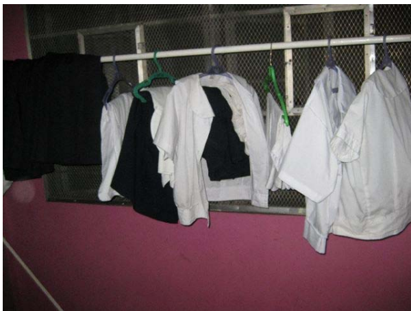
Abbildung 6 : Schuluniformen Mädchen